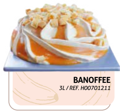
BANOFFEE 3L / REF. H00701211