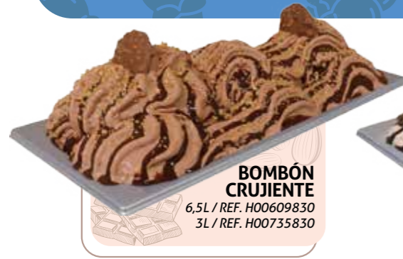
BOMBÓN CRUJIENTE 6,5L / REF. H00609830 3L / REF. H00735830