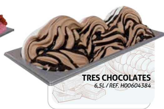
TRES CHOCOLATES 6,5L / REF. H00604384