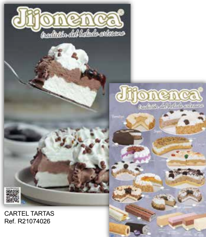
CARTEL TARTAS Ref. R21074026