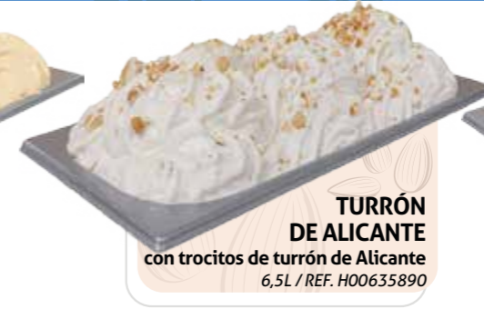
TURRÓN DE ALICANTE con trocitos de turrón de Alicante 6,5L / REF. H00635890