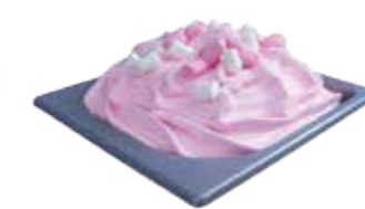
NUBE CON MININUBES

8L / REF. H00401035 6,5L / REF. H00601035 3L / REF. H00701035