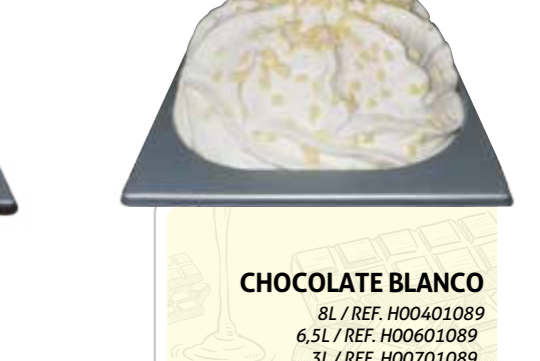
CHOCOLATE BLANCO 8L / REF. H00401089 6,5L / REF. H00601089 3L / REF. H00701089