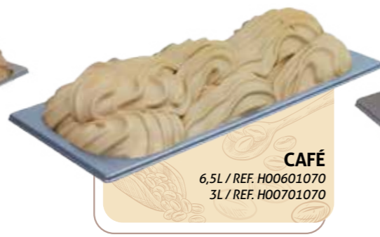
CAFÉ 6,5L / REF. H00601070 3L / REF. H00701070