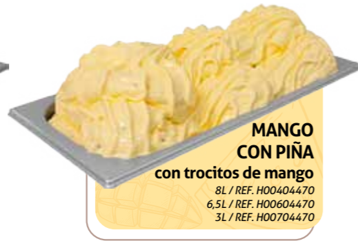
MANGO CON PIÑA con trocitos de mango

8L / REF. H00404385 6,5L / REF. H00604385 3L / REF. H00704385