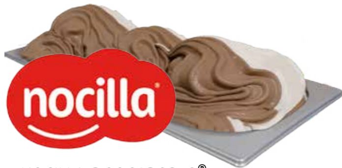
NOCILLA DOS SABORES® 6,5L / REF. H00601492