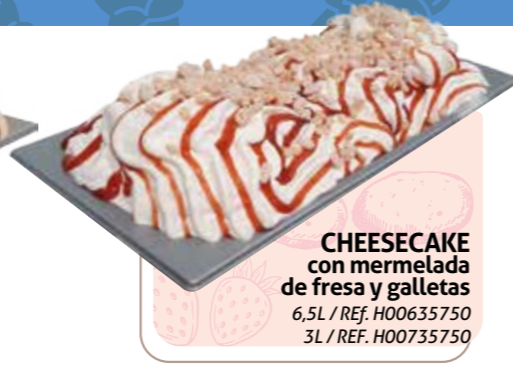
CHEESECAKE con mermelada de fresa y galletas 6,5L / REF. H00635750 3L / REF. H00735750