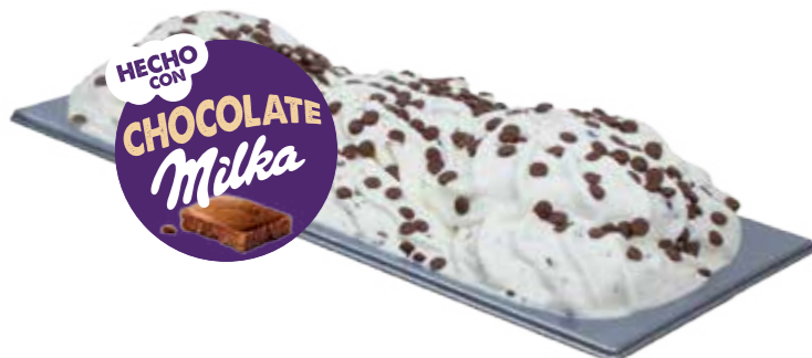
HUEVO DE CHOCOLATE CON MILKA® 6,5L / REF. H00630758