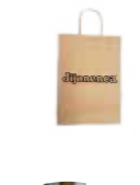
Bolsa de papel pequeña 100 Unid / CAJA REF. R21036314