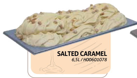
SALTED CARAMEL 6,5L / H00601078