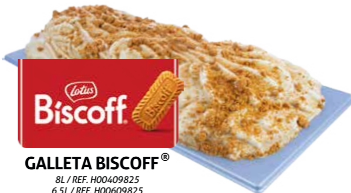
GALLETA BISCOFF® 8L / REF. H00409825 6,5L / REF. H00609825