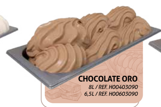
CHOCOLATE ORO 8L / REF. H00403090 6,5L / REF. H00603090