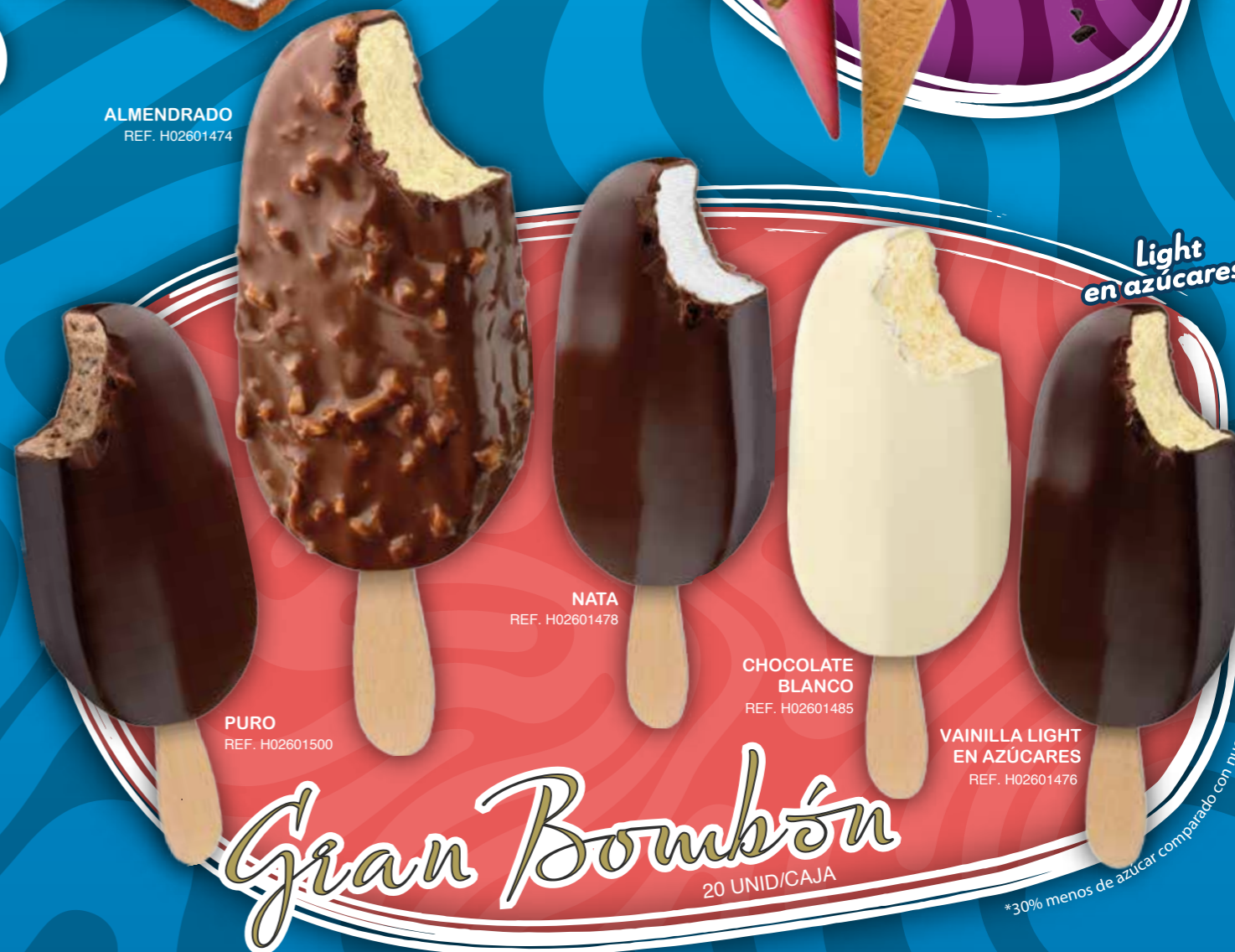
PURO REF. H02601500