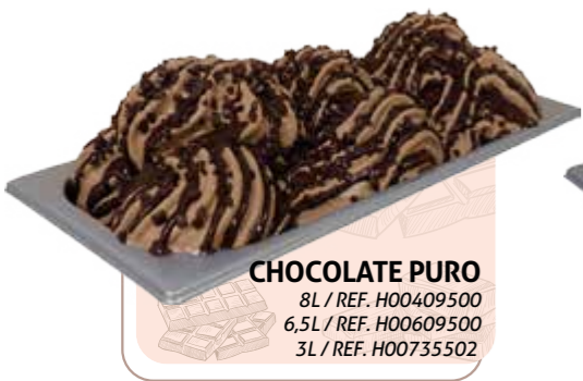
CHOCOLATE PURO 8L / REF. H00409500 6,5L / REF. H00609500 3L / REF. H00735502