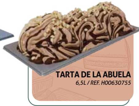
TARTA DE LA ABUELA 6,5L / REF. H00630753