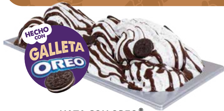
NATA CON OREO® 8L / REF. H00430601 6,5L / REF. H00635601