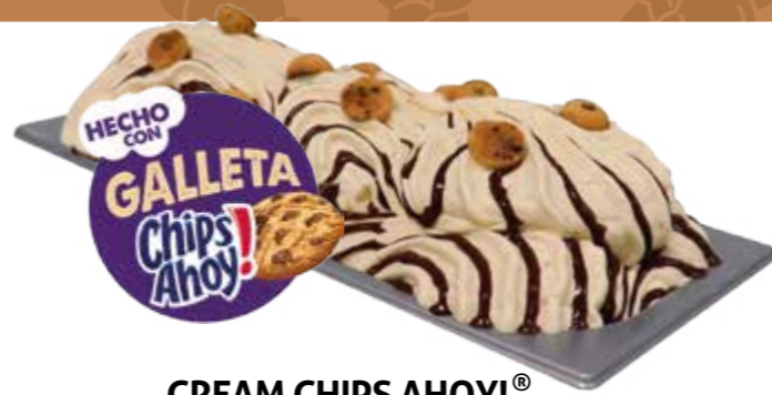
CREAM CHIPS AHOY!® 6,5L / REF. H00635506 3L / REF. H00735506