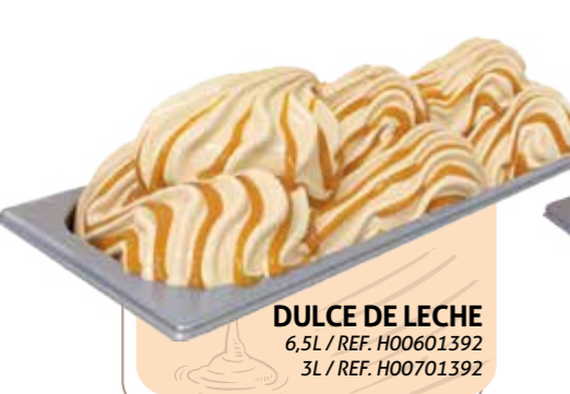
DULCE DE LECHE 6,5L / REF. H00601392 3L / REF. H00701392