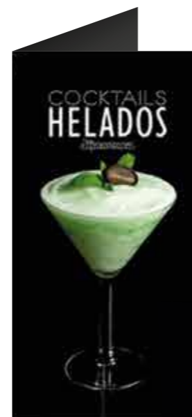
CARTA COCKTAILS R21073013