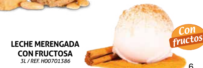
LECHE MERENGADA CON FRUCTOSA