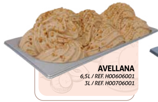
AVELLANA 6,5L / REF. H00606001 3L / REF. H00706001