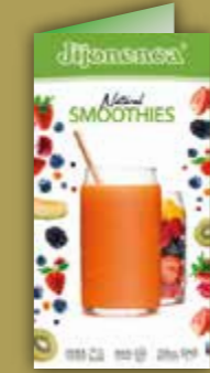
Carta Smoothies 12 sabores REF. R21073014