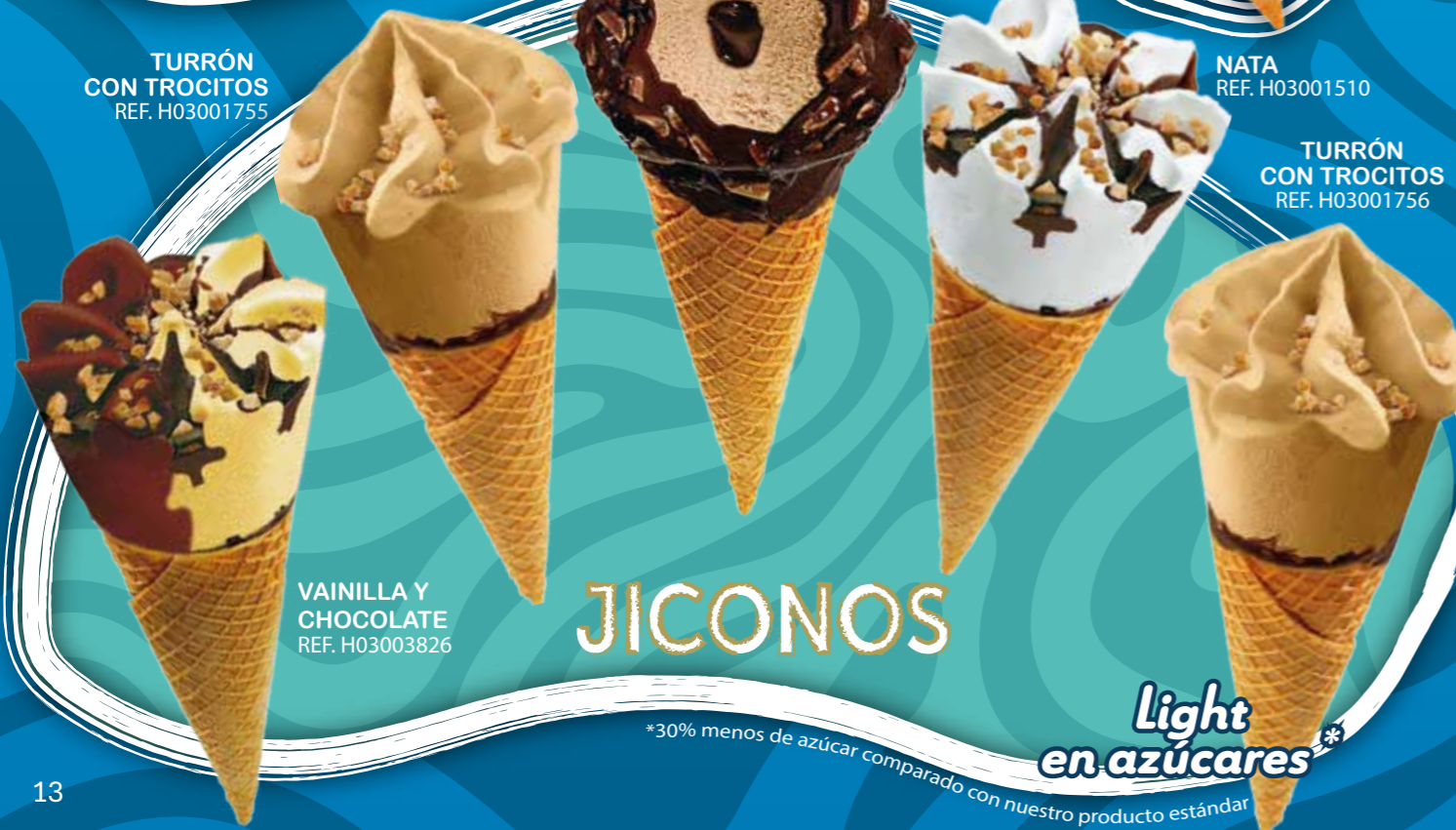
VAINILLA Y CHOCOLATE REF. H03003826