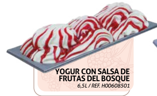
YOGUR CON SALSA DE FRUTAS DEL BOSQUE 6,5L / REF. H00608501