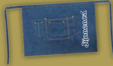
Delantal vaquero corto 1 Unid/BOLSA REF. R21072062