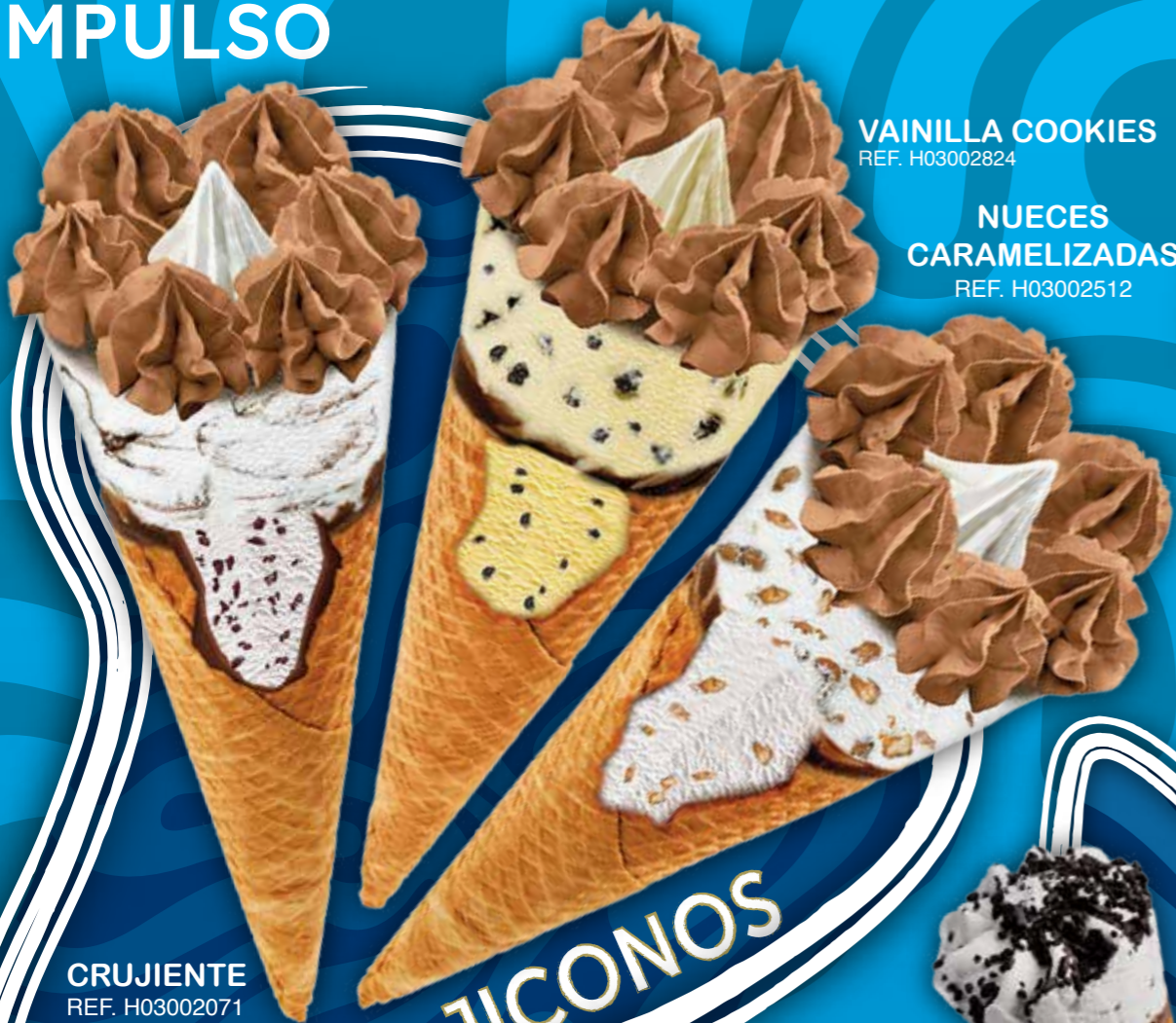
VAINILLA COOKIES REF. H03002824