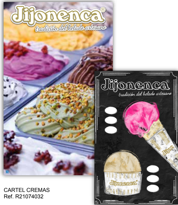
CARTEL CREMAS Ref. R21074032