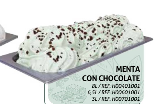
MENTA CON CHOCOLATE 8L / REF. H00401001 6,5L / REF. H00601001 3L / REF. H00701001