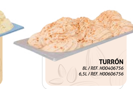
TURRÓN 8L / REF. H00406756 6,5L / REF. H00606756