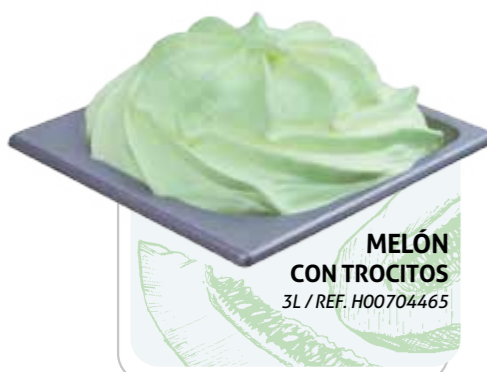
MELÓN CON TROCITOS