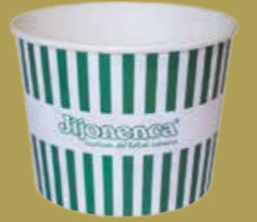
Tarrina papel 520ml 1140 Unid/CAJA REF. R21825730