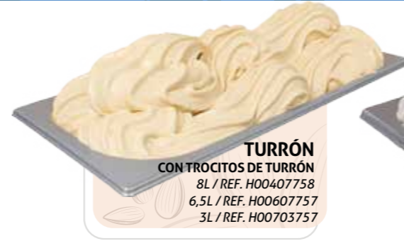
TURRÓN CON TROCITOS DE TURRÓN 8L / REF. H00407758 6,5L / REF. H00607757 3L / REF. H00703757