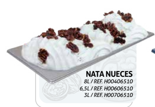
NATA NUECES 8L / REF. H00406510 6,5L / REF. H00606510 3L / REF. H00706510