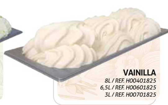
VAINILLA 8L / REF. H00401825 6,5L / REF. H00601825 3L / REF. H00701825