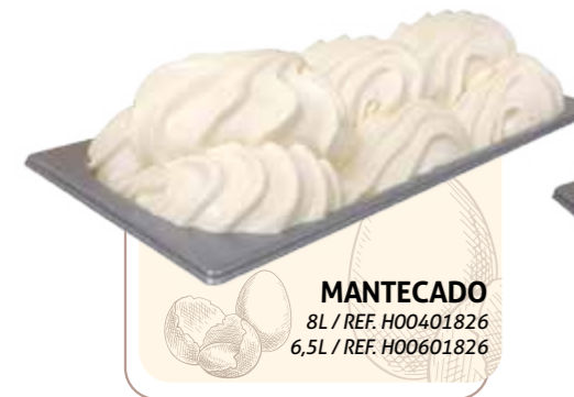
MANTECADO 8L / REF. H00401826 6,5L / REF. H00601826