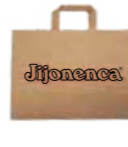
Bolsa de papel XL 125 Unid / CAJA REF. R21036319