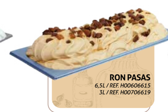
RON PASAS 6,5L / REF. H00606615 3L / REF. H00706619