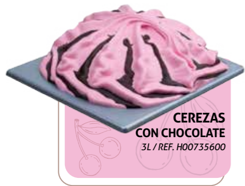
CEREZAS CON CHOCOLATE