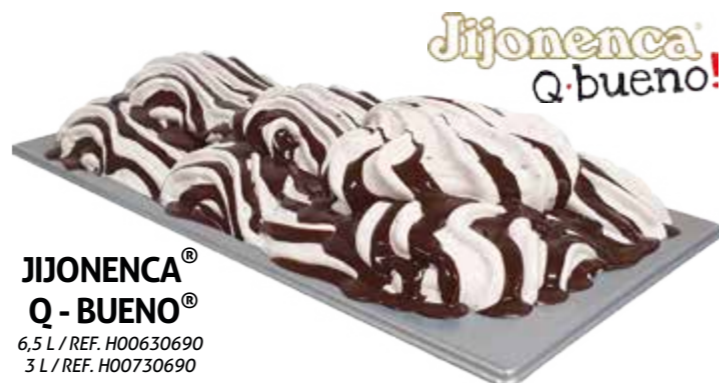
JIJONENCA® Q - BUENO® 6,5L / REF. H00630690 3L / REF. H00730690