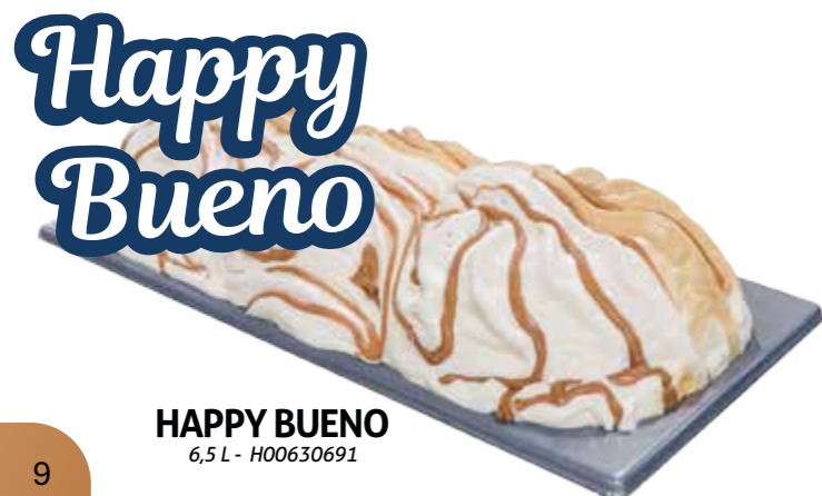
HAPPY BUENO 6,5L - H00630691