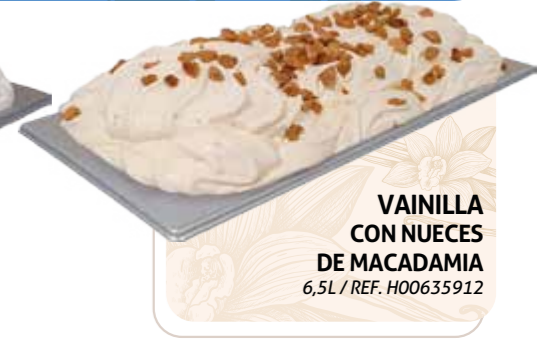
VAINILLA CON NUECES DE MACADAMIA 6,5L / REF. H00635912