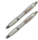
Bolígrafo Jijonenca 50 Unid/CAJA REF. R21035001