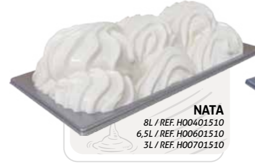
NATA 8L / REF. H00401510 6,5L / REF. H00601510 3L / REF. H00701510