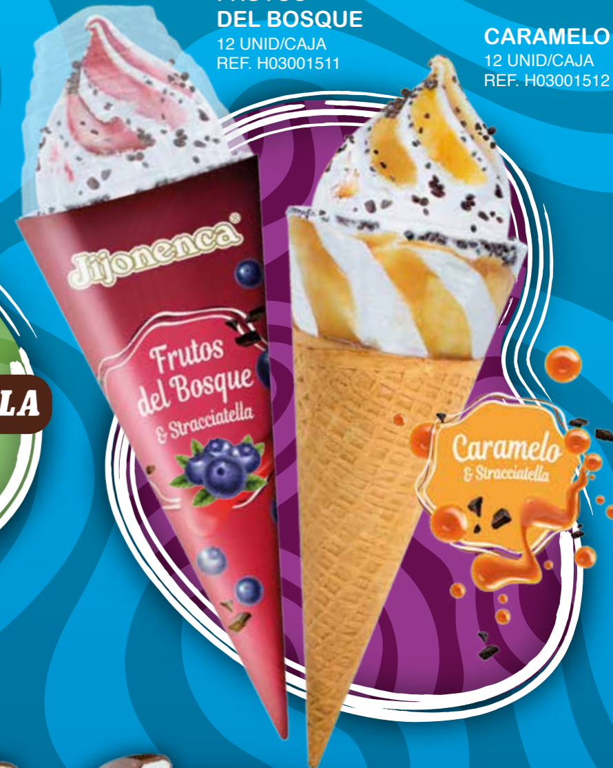
FRUTOS DEL BOSQUE 12 UNID/CAJA REF. H03001511