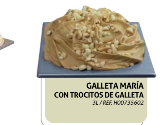
GALLETA MARÍA CON TROCITOS DE GALLETAS 3L / REF. H00735602