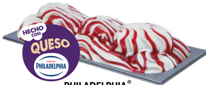
PHILADELPHIA® CON ARÁNDANOS 6,5L / REF. H00630751 3L / REF. H00730751