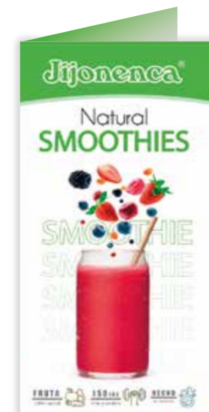
CARTA SMOOTHIES (8 SABORES) R21073012