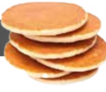
Tortitas 11cm sabor mantequilla 72 Unid / CAJA. REF. R24017033