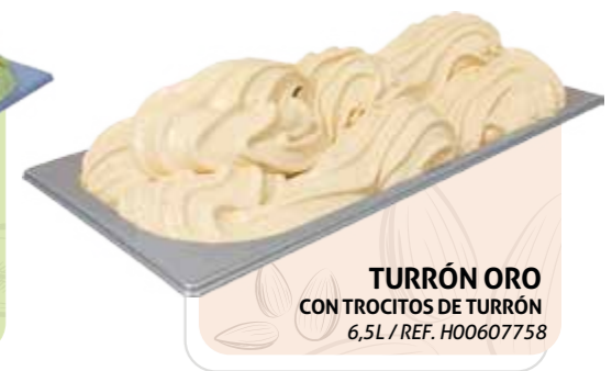
TURRÓN ORO CON TROCITOS DE TURRÓN 6,5L / REF. H00607758