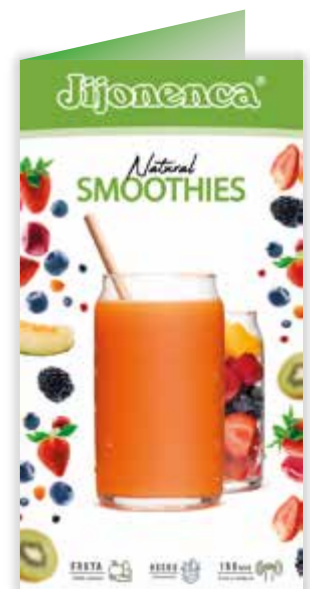
CARTA SMOOTHIES (12 SABORES) R21073014