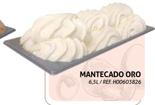
MANTECADO ORO 6,5L / REF. H00603826