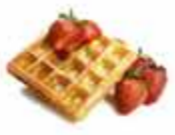
Gofres 48 Unid / CAJA. REF. R50826200