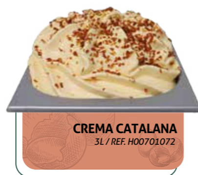
CREMA CATALANA 3L / REF. H00701072