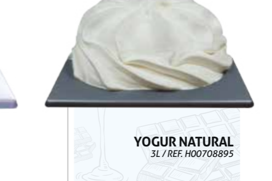
YOGUR NATURAL 3L / REF. H00708895