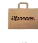
Bolsa de papel grande 45 Unid / PAQ REF. R21036315