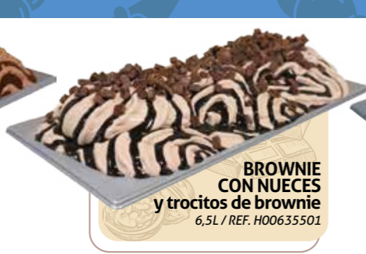
BROWNIE CON NUECES y trocitos de brownie 6,5L / REF. H00635501