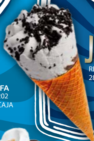
MINI JICONO REF. H03004720 28 UNID/CAJA