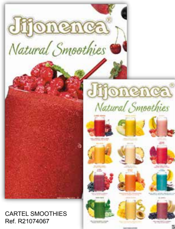
CARTEL SMOOTHIES Ref. R21074067