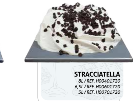
STRACCIATELLA 8L / REF. H00401720 6,5L / REF. H00601720 3L / REF. H00701720