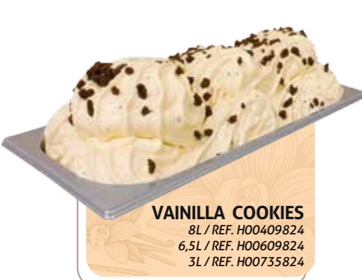
VAINILLA COOKIES 8L / REF. H00409824 6,5L / REF. H00609824 3L / REF. H00735824