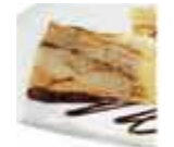
Crepes con chocolate 20 Unid / CAJA. REF. R24017002