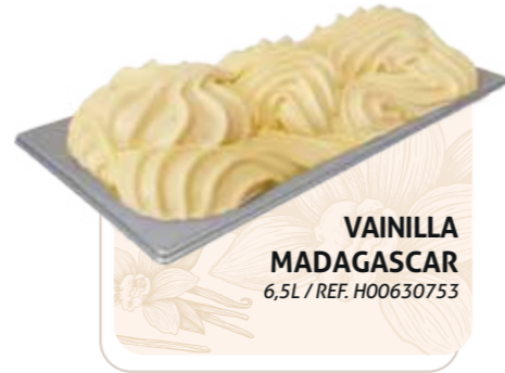
VAINILLA MADAGASCAR 6,5L / REF. H00630753