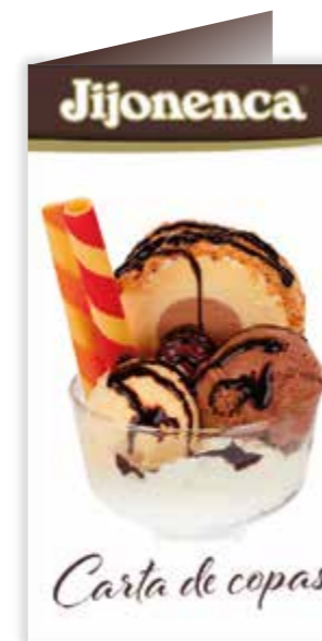
CARTA COPAS R21073003