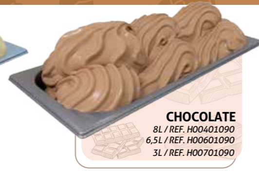
CHOCOLATE 8L / REF. H00401090 6,5L / REF. H00601090 3L / REF. H00701090