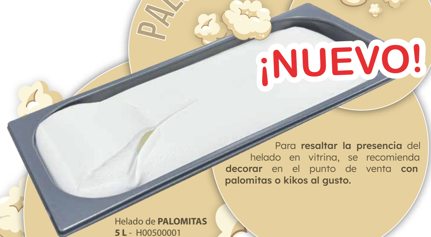
Helado de PALOMITAS 5 L - H00500001

Para resaltar la presencia del helado en vitrina, se recomienda decorar en el punto de venta con palomitas o kikos al gusto.