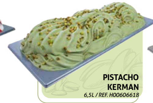
PISTACHO KERMAN 6,5L / REF. H00606618