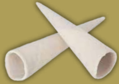
Baquillo n° 45 Chocolate blanco Sobre pedido 156 Unid/CAJA REF. R16035121