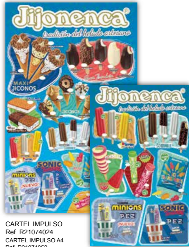
CARTEL IMPULSO Ref. R21074024 CARTEL IMPULSO A4 Ref. R21074052