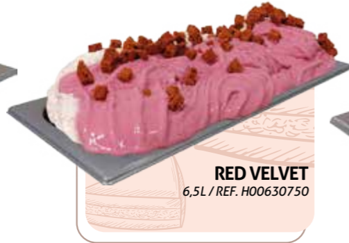
RED VELVET 6,5L / REF. H00630750