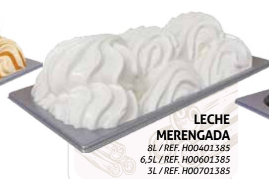
LECHE MERENGADA 8L / REF. H00401385 6,5L / REF. H00601385 3L / REF. H00701385