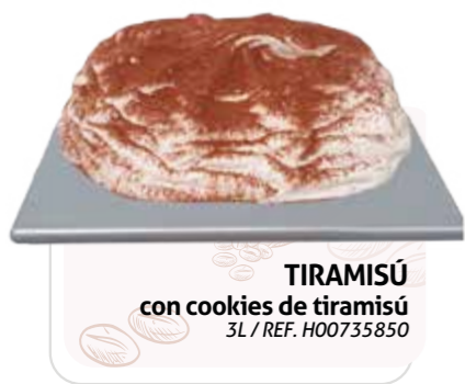
TIRAMISÚ con cookies de tiramisú 3L / REF. H00735850