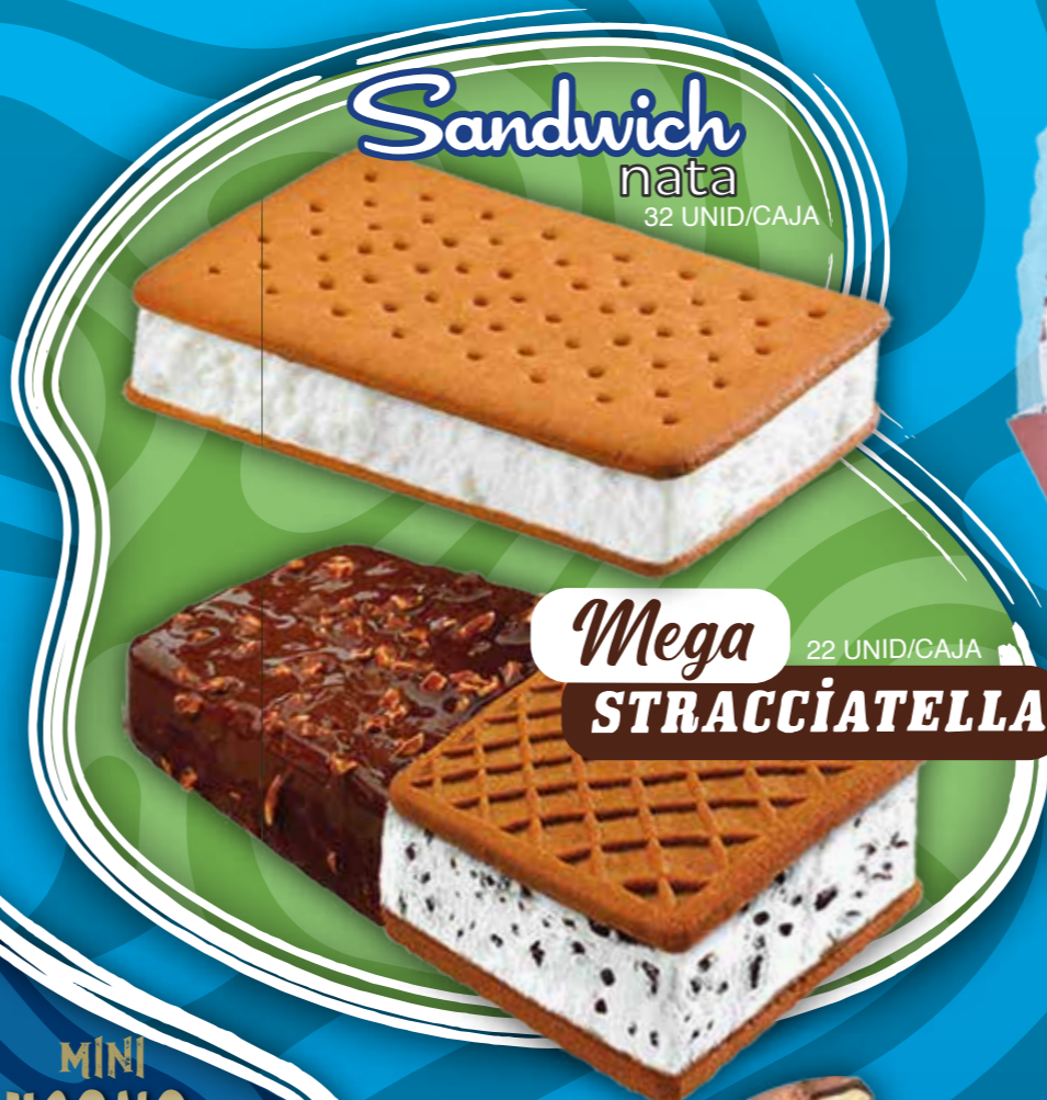
Sandwich nata 32 UNID/CAJA