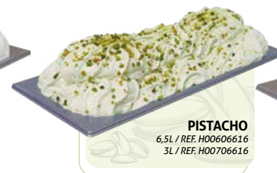
PISTACHO 6,5L / REF. H00606616 3L / REF. H00706616